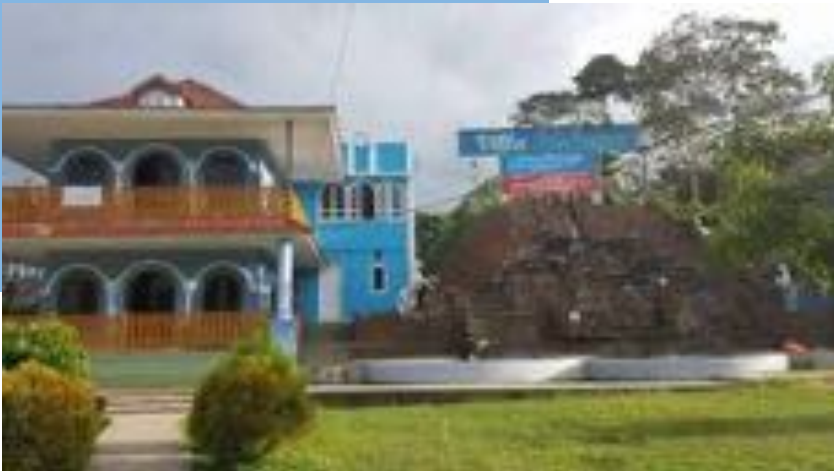
Gambar 7 Villa Lasharan

destinasi wisata ini. Villa Lasharan dikonsept sebagai sebuah villa yang mendukung wisata alam. Villa ini dibangun atas dasar apresiasi dan kemauan untuk membangun kampung halamannya. Villa Lasharan dilengkapi dengan waterpark yang selain menunjang villa, juga dimanfaatkan oleh sekolah-sekolah yang ada di Enrekang untuk kegiatan olahraga air. Kombinasi antara villa dan waterpark menghasilkan sebuah wahana wisata edukasi bagi wisatawan yang datang ke Enrekang dan Toraja. Sahban bercita-cita bahwa Kalimbu akan menjadi pintu gerbang wisatawan yang dalam perjalanan menuju ke Toraja.