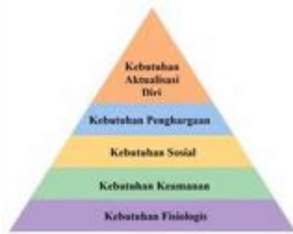
Gambar 9 Teori Hirarki Kebutuhan Maslow

keamanan, sosial, penghargaan, dan berpuncak pada aktualisasi diri.