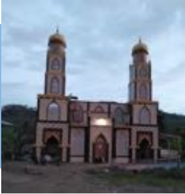
Gambar 5 Mesjid Al Mukhlisin, Makassar