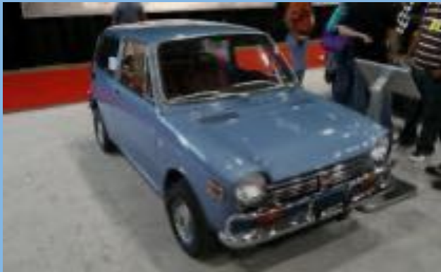
Gambar 4 Mobil Honda Life Klasik