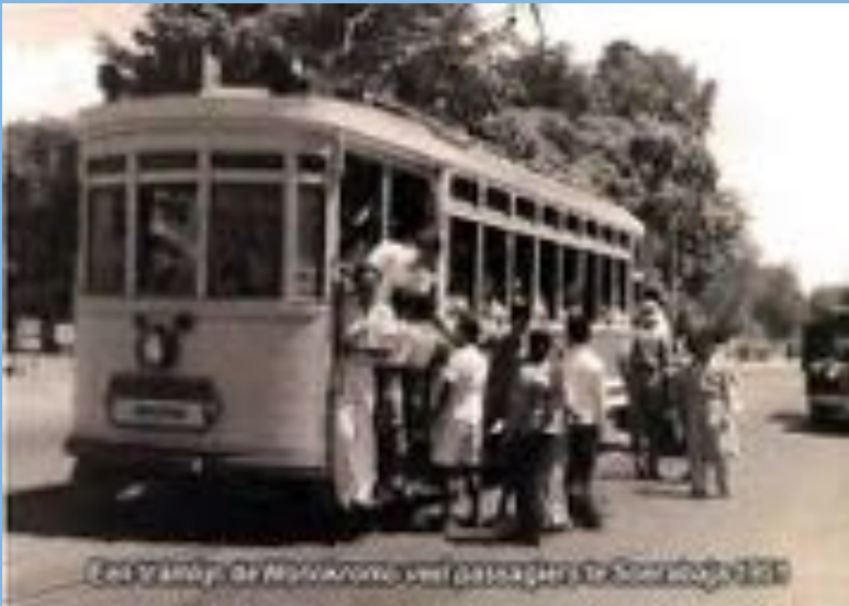
Gambar 3 Trem di Surabaya Tahun 1951

Diatas Trem Sahban merasa tegang, mau bertanya kepada siapa, dan apa pertanyaannya semuanya serba bingung. Tapi hati tetap tegar menghadapi semua ini, karena Sahban berprinsip, asal niat yang baik pasti di kasih petunjuk oleh Allah SWT. Disamping itu, Sahban selalu membaca ayatul kursi berkali-kali, sesuai nasehat orang tuanya sebelum berangkat.