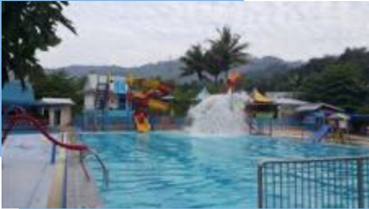
Gambar 8 Waterpark Lasharan

Sahban juga meneruskan pendidikannya ke jenjang doktoral (S2) di Universitas Negeri Jakarta. Tanggal 15 Oktober 2009, Sahban berhasil meraih gelar doktor dengan predikat Sangat Memuaskan. Gelar doktor di bidang Manajemen Pendidikan ini diperolehnya pada usia 72 tahun. Disertasinya berjudul “Evaluasi Pelaksanaan Kebijakan Penjaminan Mutu Pendidikan Tinggi Periode 2003-2010”. Disertasi ini kemudian diadaptasi menjadi buku berjudul “Kebijakan Penjaminan Mutu Pendidikan Tinggi di Indonesia: Perspektif Teoritis dan Empiris”. Buku ini kemudian mengantarkannya meraih dua buah penghargaan. Pertama, ia mendapatkan penghargaan Tokoh Teladan Pendidikan dari AS Center, yang dipimpin oleh Prof. DR. Aminuddin Salle, SH, MH. Penghargaan ini diterima pada saat bedah bukunya di Gedung Lasharan Garden, tanggal 20 Februari 2010. Kedua, Sahban juga mendapatkan penghargaan dari Koordinator Perguruan Tinggi Swasta